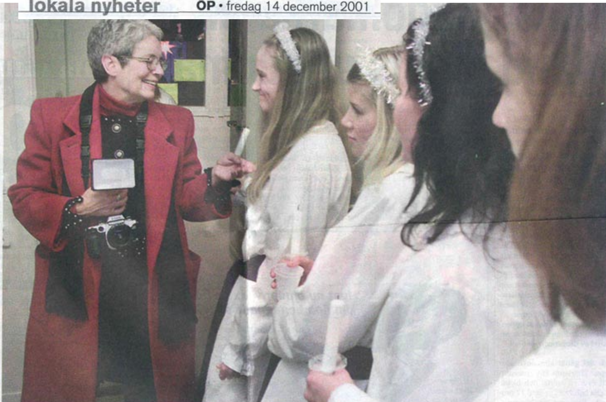
Fotografen Paola Gianturco dokumenterade alla lucior och tärnor hon såg i går. Bilderna ska ingå i hennes bok om kvinnliga ceremonier. Här frågar hon ut tärnorna i Länets Luciataåg om de kan sjunga. "Bara en av oss", svarade tärnorna.