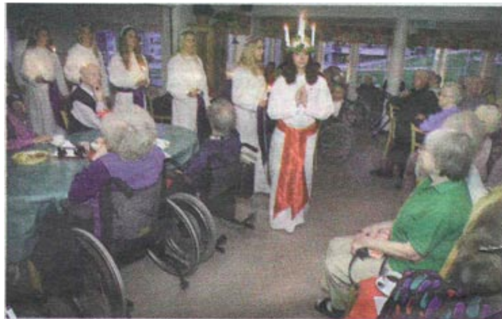
Lövberga äldreboende var en av alla platser som Länets Lucia-tåg besökte. deras framträdande var snabbt, och efter sången höll en av pensionärerna tal och då kom Luciatåget nästan av sig. De stannade lite längre.